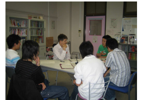
Talk! Talk! Talk!